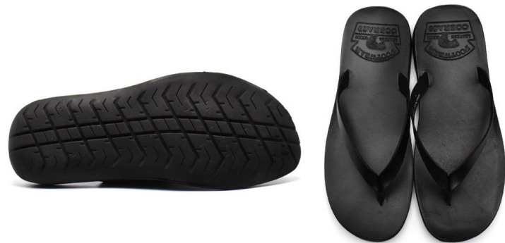
THONG SANDAL 69001