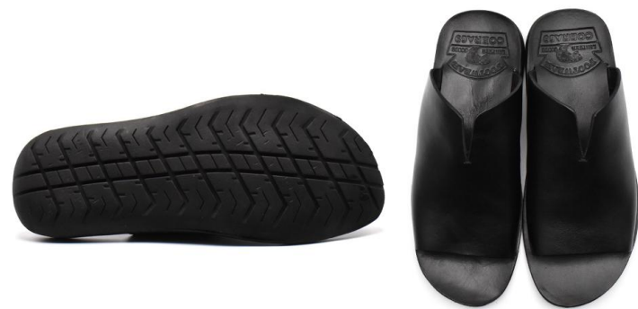
SLIDE SANDAL 69003