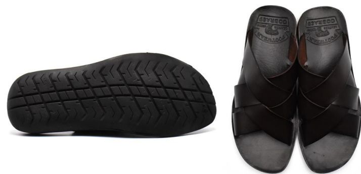
CROSS SANDAL 69002