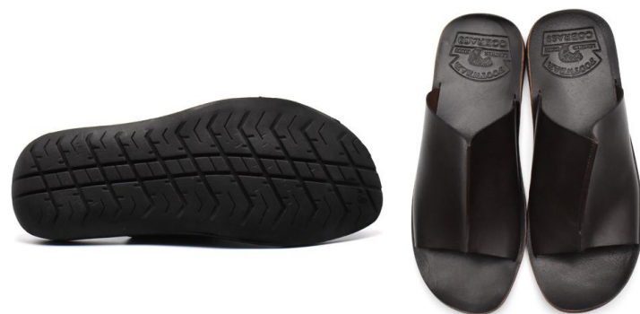
CENTER SEAM SANDAL 69000